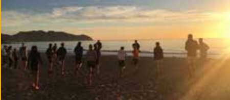
Fitnessstraining am Strand