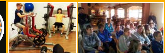
Tägliches Work Out