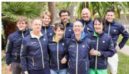
Das Trainerteam vor Ort